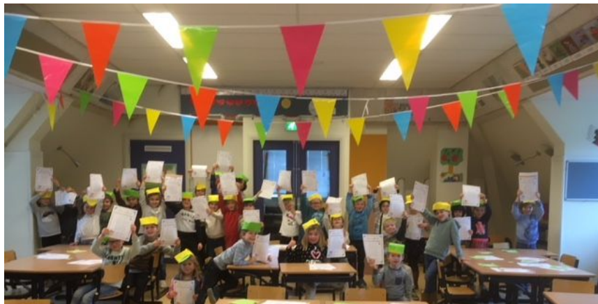
De letterkampioenen uit groep 3

Met lezen is kern 6 afgerond, een belangrijk meetmoment. We hebben een fijn Letterfeest gevierd met heuse letterpet, soep met lettervermicelli en letterchipjes. We hebben een spannende letterbingo gedaan en een woorden verzin race. Trots op de letterkampioenen van groep 3! Het lettercertificaat en oefenkampioen blad, kunt u thuis gebruiken om elke dag even (max 10 min) te oefenen met uw kind.